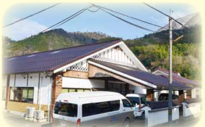
津和野町デイサービスセンター