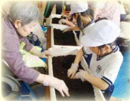
地域の学校等との交流