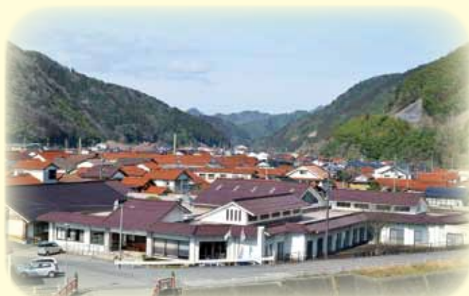
特別養護老人ホームシルバーリーフつわの